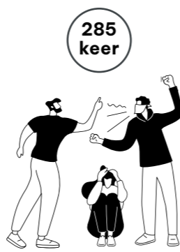
285 keer vijandige bejegening