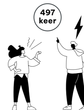
497 keer uitlating